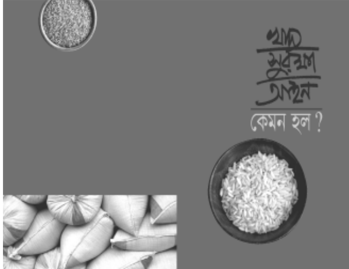
১/১৬ ডিমাই সাইজ। হোয়াইটপ্রিন্ট। ৬৮। ৫০ টাকা